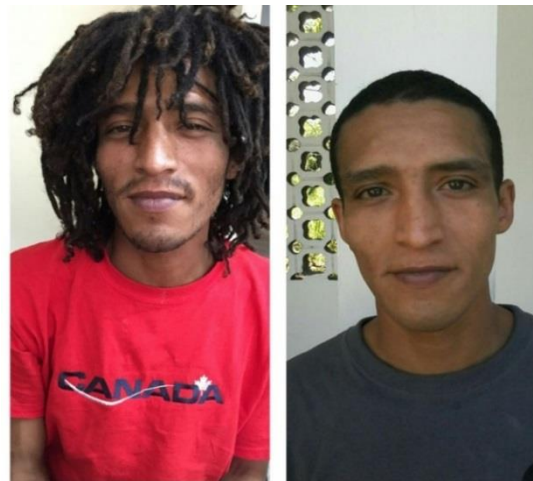
Antes y Después del ingreso al Proyecto Multimodal en el Hospital Mental de Antioquia