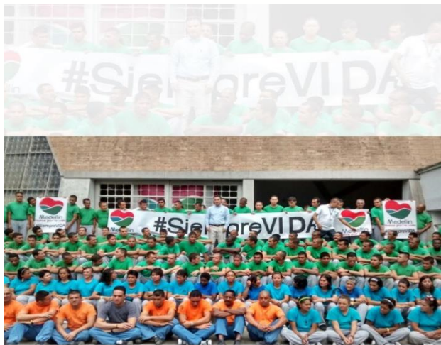
Fase 2 y 3 Protección

FASE 4 Dignidad y vida en Greiff , buscando intervenir el restante de la población que resta por ser protegida, logrando proteger a 156 habitantes de calle para un total de 600 personas en rehabilitación entre fase 3 y 4.